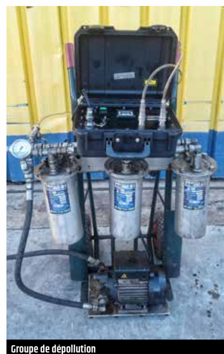
Groupe de dépollution