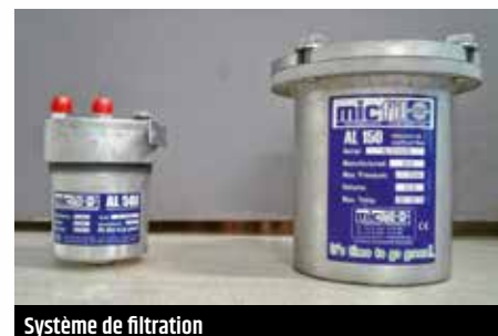
Système de filtration